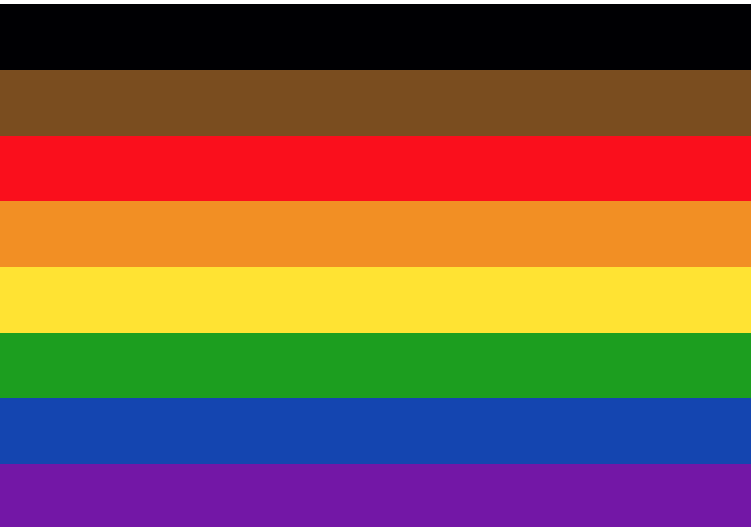
La bandiera del Pride di Philadelphia