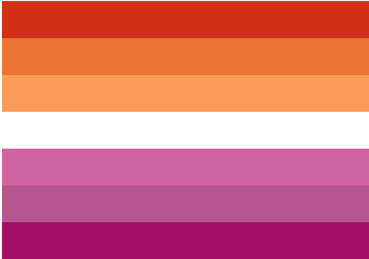
La bandiera della comunità lesbica