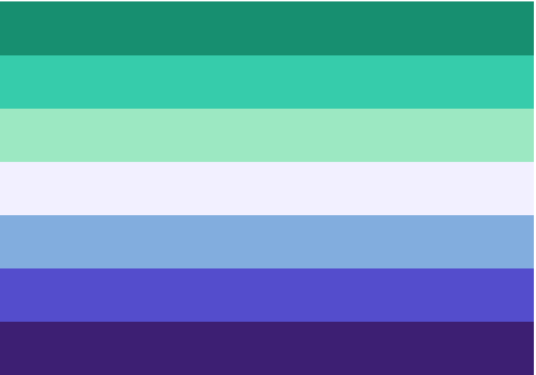
La bandiera dell'orgoglio gay