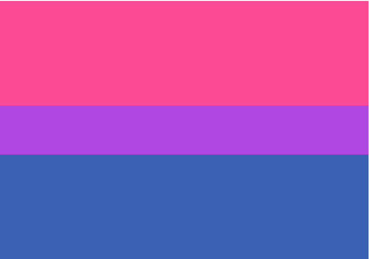
La bandiera dell'orgoglio bisessuale