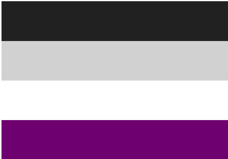
La bandiera della comunità asexuale