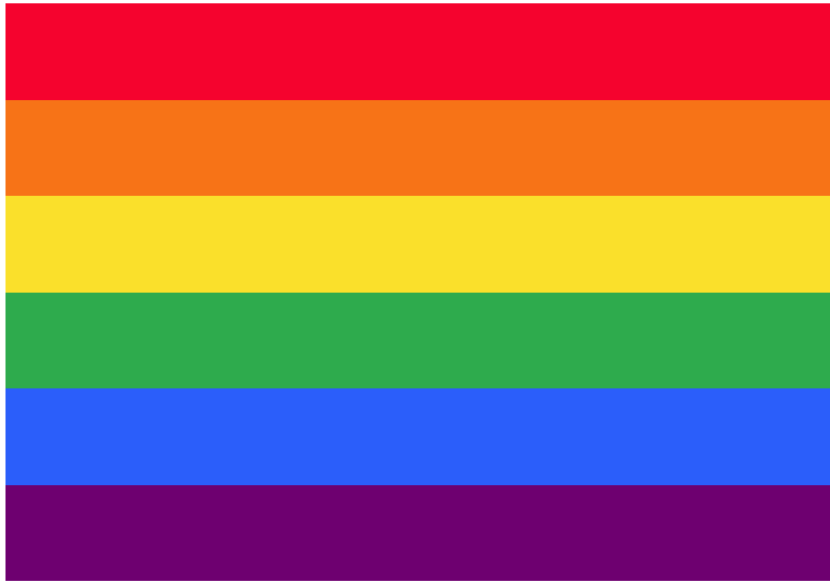
La bandiera del Pride a 6 colori